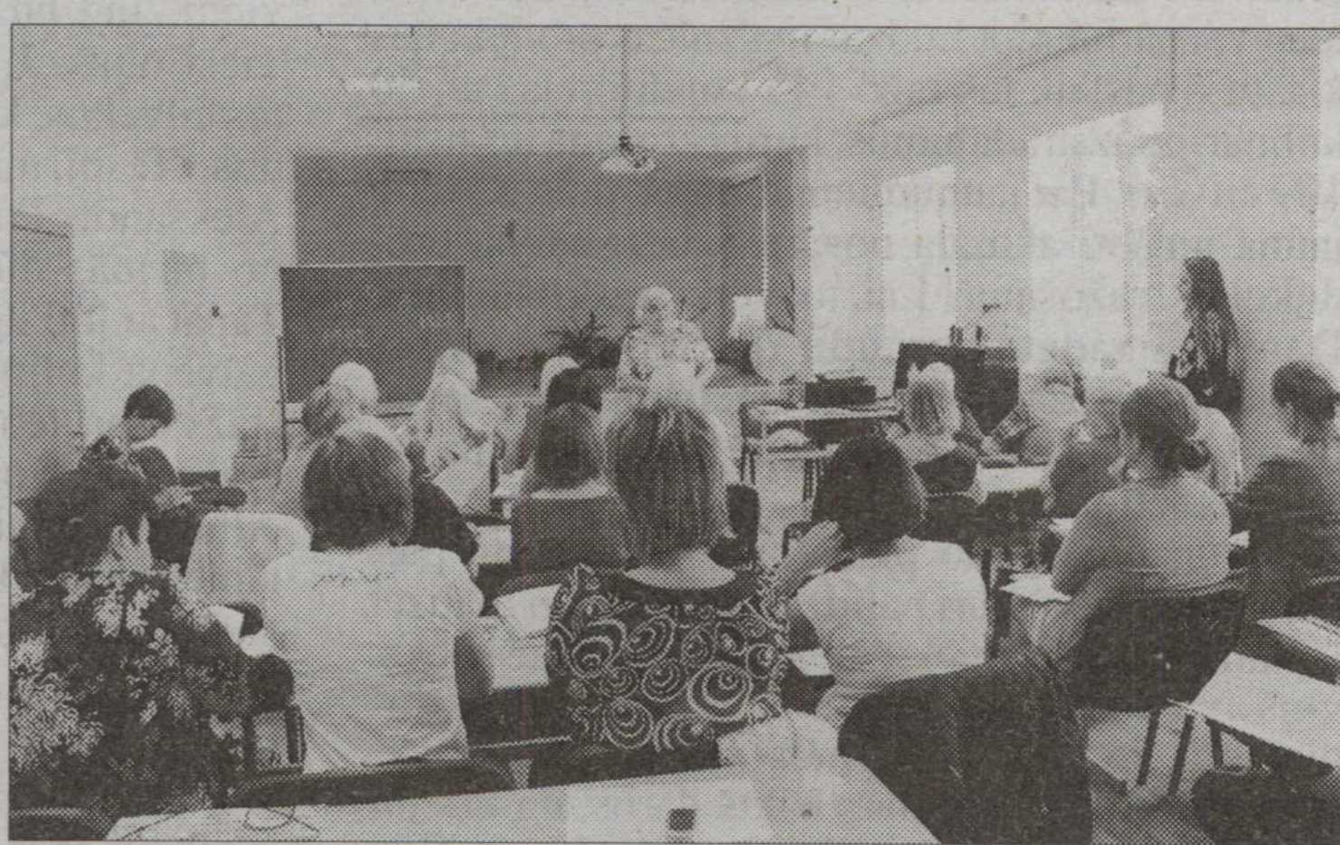
Kursiem var pieteikties līdz 16. jūlijam.

Organizatori vasaras kursiem aicina pieteikties skolotājus no visas Latvijas, kuri jau šobrīd